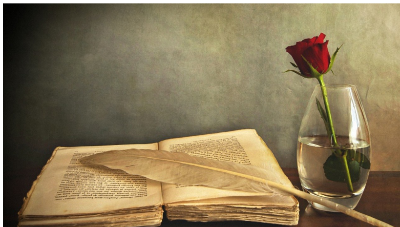
Preuzeto: Semerkand, god. I, br. I I, 2009

Osoba koja je izvučena prije traženja hrane je pitala prijatelje da prije izlaska klanja nafilu namaz. Dok je on klanjao, na vrata je došao čovjek poslan od izaslanika Egipta I prozvaši sve redom, dao im je po vrećicu u kojoj je bilo 50 dinara (zlatni novac) I ovako objasnio: "Dok je naš izaslanik jučer spavao podnevni san, u snu mu je ovako rečeno: 'Znalcima Muhammedima, koji su vrijedni hvale, se stomak zalijepio za leđa od gladi.'" Zbog toga je poslao ove torbice I zakleo se da će čim vam ovo nestane, ako mu javite, opet pomoći.